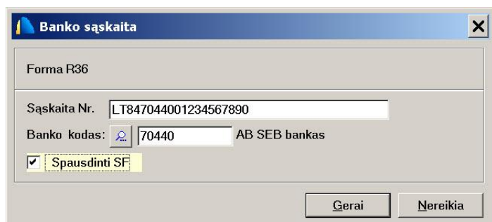
Pav. 6-1. Atsiskaitomųjų sąskaitų spausdinimo SF nustatymas

Kai įmonė turi daug atsiskaitomųjų sąskaitų, o pardavimo SF norima spausdinti tik kai kurias iš jų, menu „Žinynai – Įmonės rekvizitai“ atsiskaitomųjų sąskaitų lentelėje galima nurodyti kurias sąskaitas spausdinti sąskaitose – faktūrose, o kurių ne (pav. 6-1).